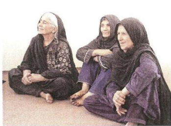
ゴレーク村のお産婆さんたち。それぞれの地域の妊婦さんたちが頼りにしています。

支援活動は、おかげさまで、アフガニスタンの人たちが自身で取り組む生活改善のための試みが成果が出るよう、これからも応援していきます。アフガニスタン 長谷部 貴俊