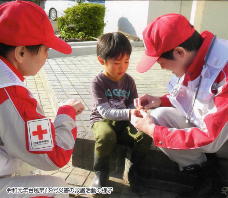
令和元年台風第19号災害の救護活動の様子