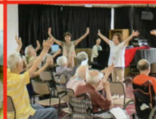
赤十字ボランティア