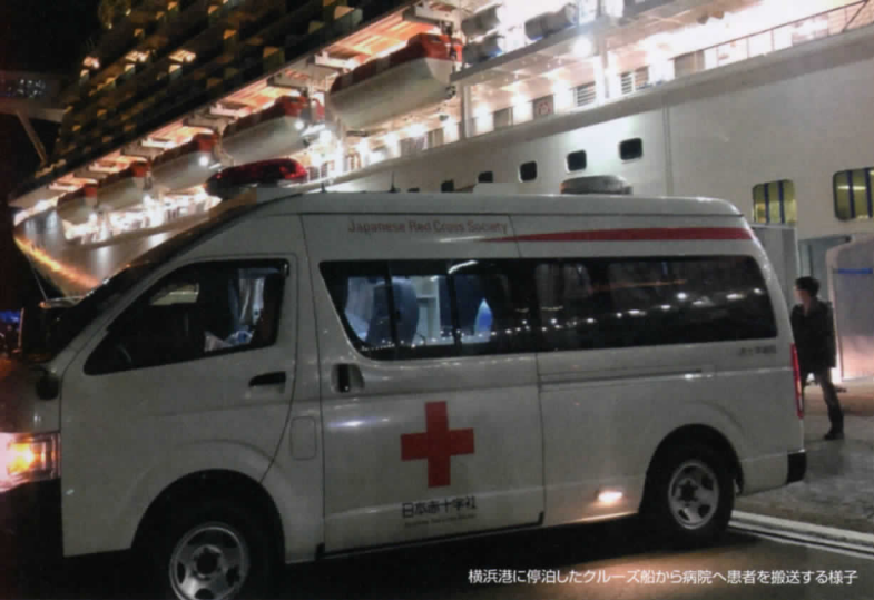
横浜港に停泊したクルーズ船から病院へ患者を搬送する様子