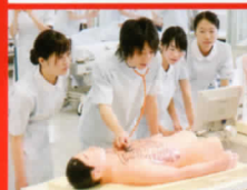
看護師等養成事業